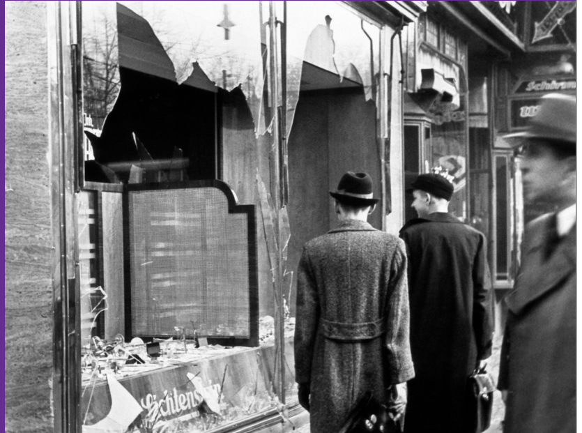
Dinistriwyd siopau a busnesau Iddewig yn ystod y Noson Grisial ym 1938

Ym 1933 daeth y Natsïaid i rym yn yr Almaen, a daeth bywyd yn fwyfwy anodd i Iddewon Almaenig. Pasiwyd deddfwriaeth gwrth-Iddewig, a oedd yn gwadu rhyddid o bob math i Iddewon a chyfyngu ar eu hawliau, gan ddechrau trwy eu hatal rhag gweithio mewn proffesiynau penodol ac ysgolion a phrifysgolion. Ym 1935, fe wnaeth Deddfau Nuremberg gyfyngu ar bwy y gallai Iddewon briodi, ac aeth ymhellach na hynny: fe wnaethon nhw ddiffinio unrhyw un a oedd â thri neu bedwar o neiniau a theidiau Iddewig fel Iddewon, ni waeth a oedd y person hwnnw'n ystyried ei hun yn Iddew ai peidio. Felly roedd deddfau Nuremberg yn dileu rhyddid crefyddol a rhyddid pobl i ddewis eu hunaniaeth. Ar 9 Tachwedd 1938, ymosodwyd ar siopau a busnesau Iddewig yn nhiriogaethau'r Natsïaid, a'u dinistrio. Daeth y noson yn adnabyddus fel Kristallnacht - y noson grisial. Cafodd pobl Iddewig eu gwahardd o sinemâu, theatrau a chyfleusterau chwaraeon.